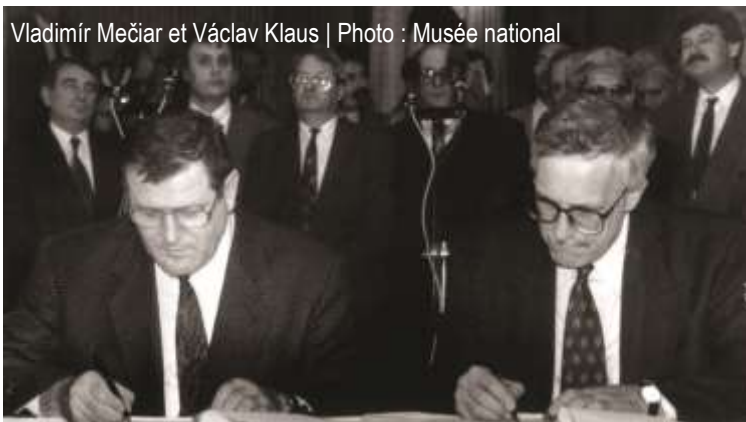
Vladimír Mečiar et Václav Klaus | Photo : Musée national

On entend souvent dire que cette partition a d'abord été une décision politique, et que si les deux peuples avaient été consultés dans le cadre d'un référendum , l'issue aurait pu être différente. Quel est votre avis sur cette vision des choses ?