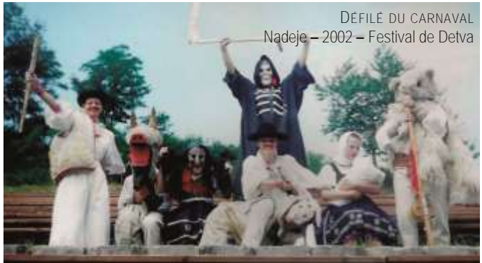
DÉFILE DU CARNAVAL Nadeje – 2002 – Festival de Detva

bien sûr de la boisson. Le point culminant, final du carnaval, était le Mardi gras : celui de la dernière musique associée à l'Enterrement de la contrebasse. Le lendemain, mercredi des Cendres, débutait le Carême.