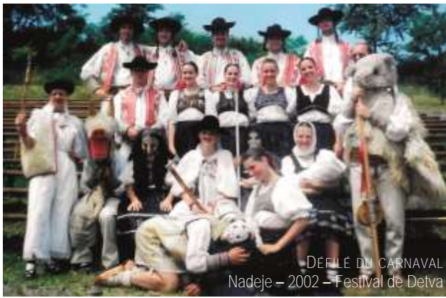
DÉFILE DU CARNAVAL Nadeje – 2002 – Festival de Detva

Les traditions du Carnaval, associées aux défilés de personnes masquées, sont une transition entre les vacances de Noël et de Pâques. Elles se déroulent de l'Épiphanie (Fête des Rois Mages le 6 janvier) au mardi précédant le mercredi des Cendres. Les derniers jours du carnaval sont les plus célèbres et les plus joyeux car associés aux plaisirs et aux festins.