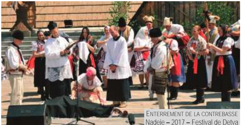
ENTERREMENT DE LA CONTREBASSE Nadeje – 2017 – Festival de Detva