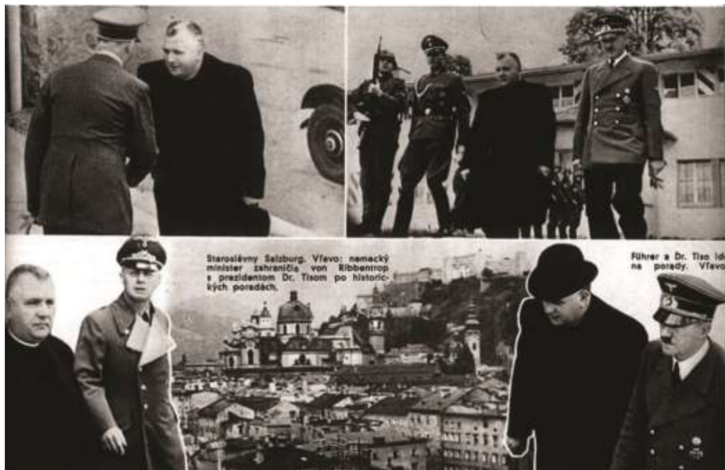
Le président de la République slovaque, Josef Tiso avec Adolf Hitler en 1940

« Au-delà de sa taille, il faut aussi parler des relations avec les autres États. La Tchécoslovaquie a d'abord entretenu de très bonnes relations avec la France notamment. Mais l'année 1938 et tout ce qui s'est passé après ont montré que même ces bonnes relations avec des États forts et stables ne constituaient pas une garantie de sécurité face à la menace de l'Allemagne nazie. »